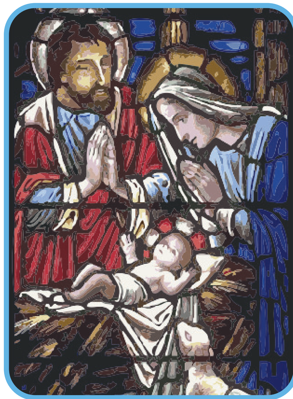
A Sagrada Família, primeiro e mais perfeito exemplo de amor, apoio e cuidado mútuo.