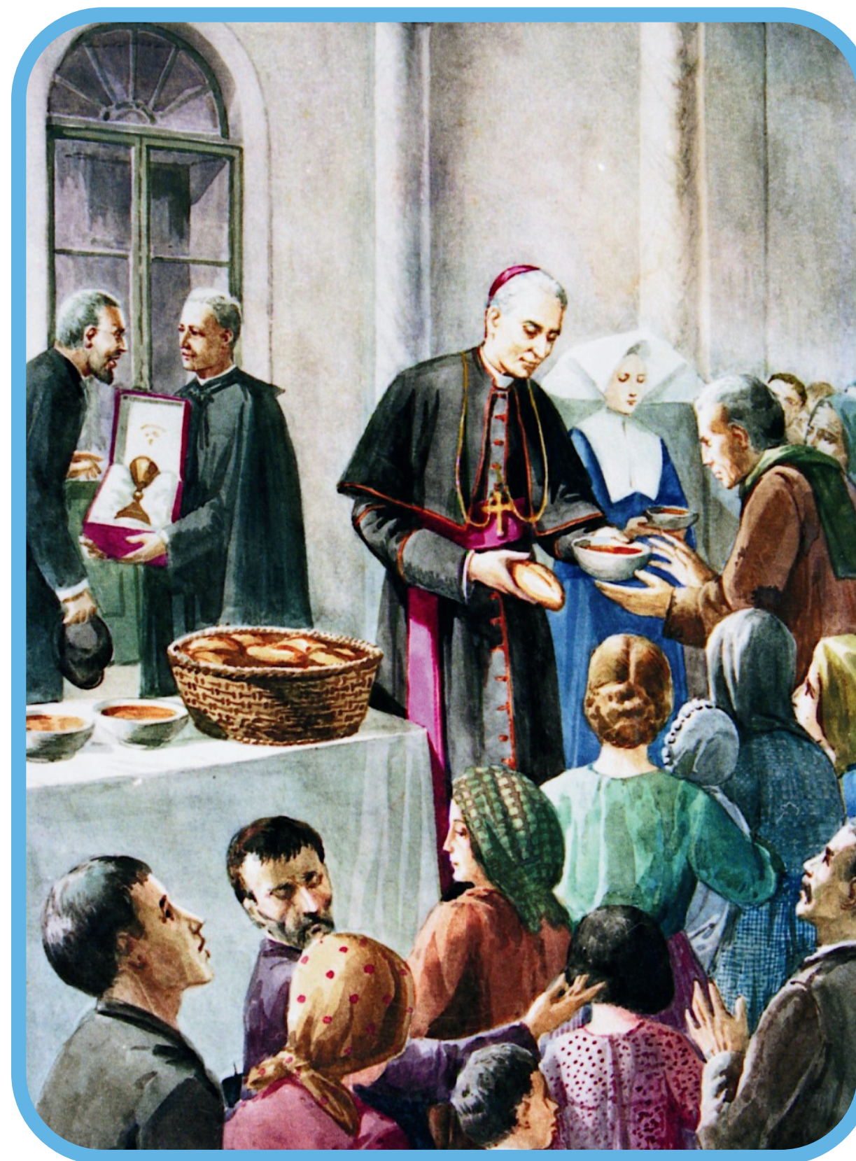
São Scalabrini distribuía alimentos e roupas aos necessitados.