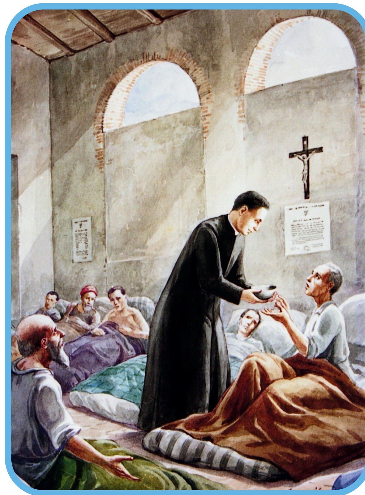
1867, São Scalabrini ajudando aqueles que foram afetados pela epidemia de cólera que atingiu a região de Como, Itália.